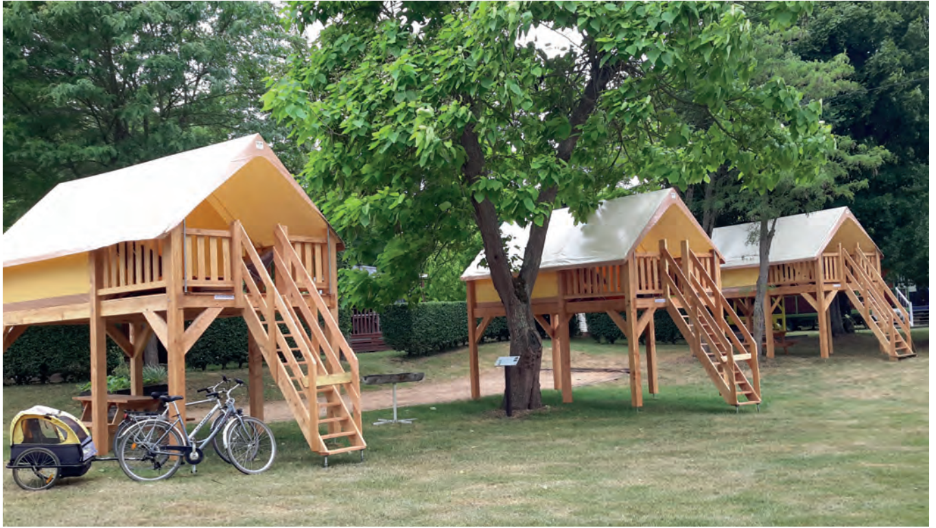
Tentes surélevées « Abricyclos » au camping de Gien, la Loire à vélo.