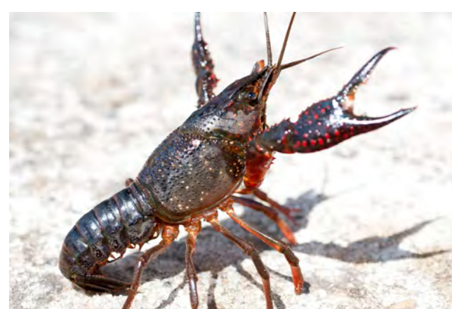
Écrevisse de Louisiane

Cette espèce exotique invasive peut être pêchée toute l'année. Les professionnels pousseraient même à la consommation tant la population d'écrevisses de Louisiane est envahissante. ■