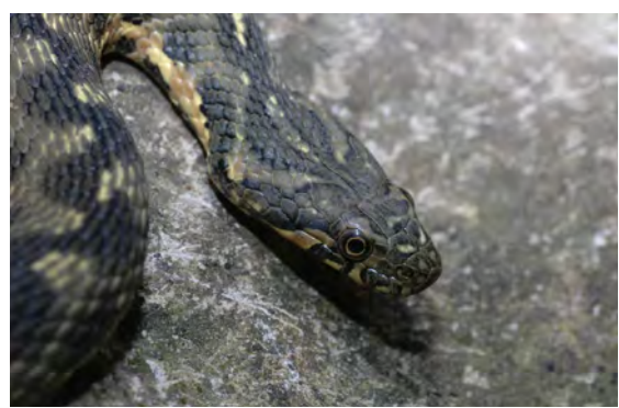
Couleuvre vipérine Muséum d'histoire naturelle de Bourges

Plus près du sol même s'il se fait plus discret, il est possible d'aller à la rencontre du lézard vert. Rencontre qui est souvent fortuite. L'animal aime bien les broussailles, il a trouvé là de quoi satisfaire ses envies. Les spécimens sont nombreux.