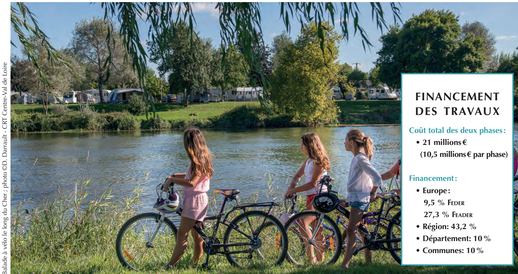
Balade à vélo le long du Cher ; photo ©D. Darrault - CRT Centre-Val de Loire

« La Loire à vélo a été un vrai facteur de motivation »