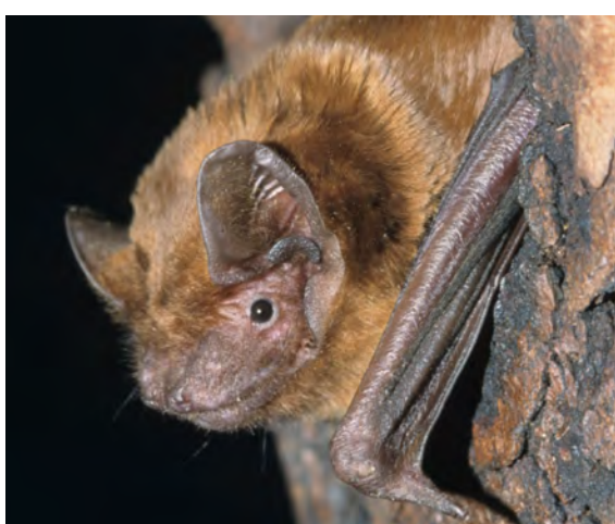
Noctule Muséum d'histoire naturelle de Bourges

En gardant le nez en l'air on observe toutes sortes d'espèces d'oiseaux qui ne sont pas propres à mon environnement, et qui fréquentent bien d'autres lieux. C'est le cas des pics qui jouent des percussions avec leur bec sur les troncs des